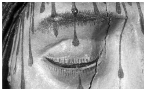
Detalje fra korbuekrucifikset i Sankt Mortens Kirke i Næstved