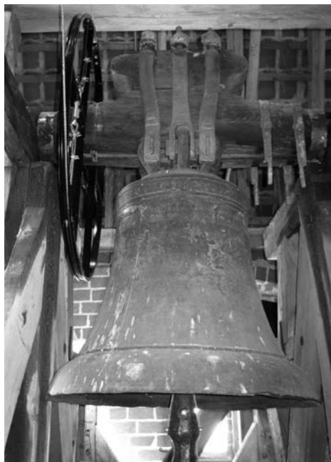
Gamst-Klokken i Vejlø Kirke efter automatisk ringning.

Gennem århundreder har graveren besteg tårnet via den snævre vindeltrappe og har trukket klokken i gang med rebet. Der skal en særlig teknik til at få den store klokke med en vægt på ca. en halv ton til at komme i svingninger. Gode muskler og stærke arme kræves for at forvandle det tonstunge malm til liflig klokkeklang.