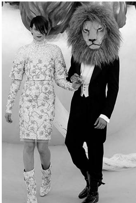
Karl Lagerfelds (Chanel) bud på et brudepar.

Sæt kryds i kalenderen tirsdag 7. juni! Turen går til Sophienholm, Jægerhuset og Søllerød Kirke. Mere om dagen i næste nummer.