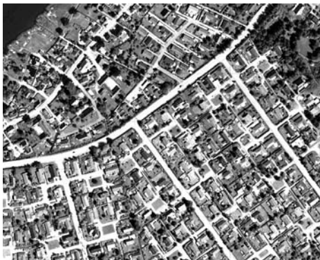
Udsnit af Appenæs - set fra luften.

Tirsdag 7. februar fortæller Gösta Backström om livet i en muslimsk landsby i Ghana, om audiens hos en høvding, besøg hos en bonde med fire koner og 18 børn og om Guldkysten, hvorfra slaverne blev udskibet. Plus en lille film om at være Kone nr. 2 .