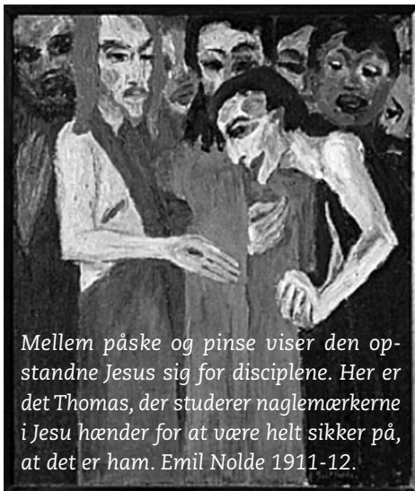
Mellem påske og pinse viser den opstandne Jesus sig for disciplene. Her er det Thomas, der studerer naglemærkerne i Jesu hænder for at være helt sikker på, at det er ham. Emil Nolde 1911-12.